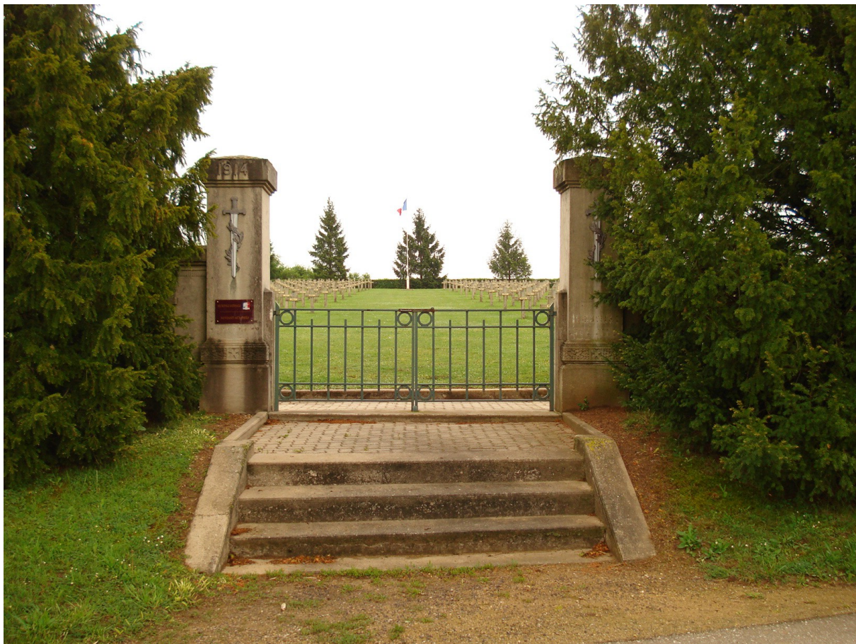
Nécropole militaire de NOVIANT-AUX-PRÉS (Meurthe-et-Moselle) : sépulture de Jean-Pierre FERRÉ (tombe individuelle n° 48).