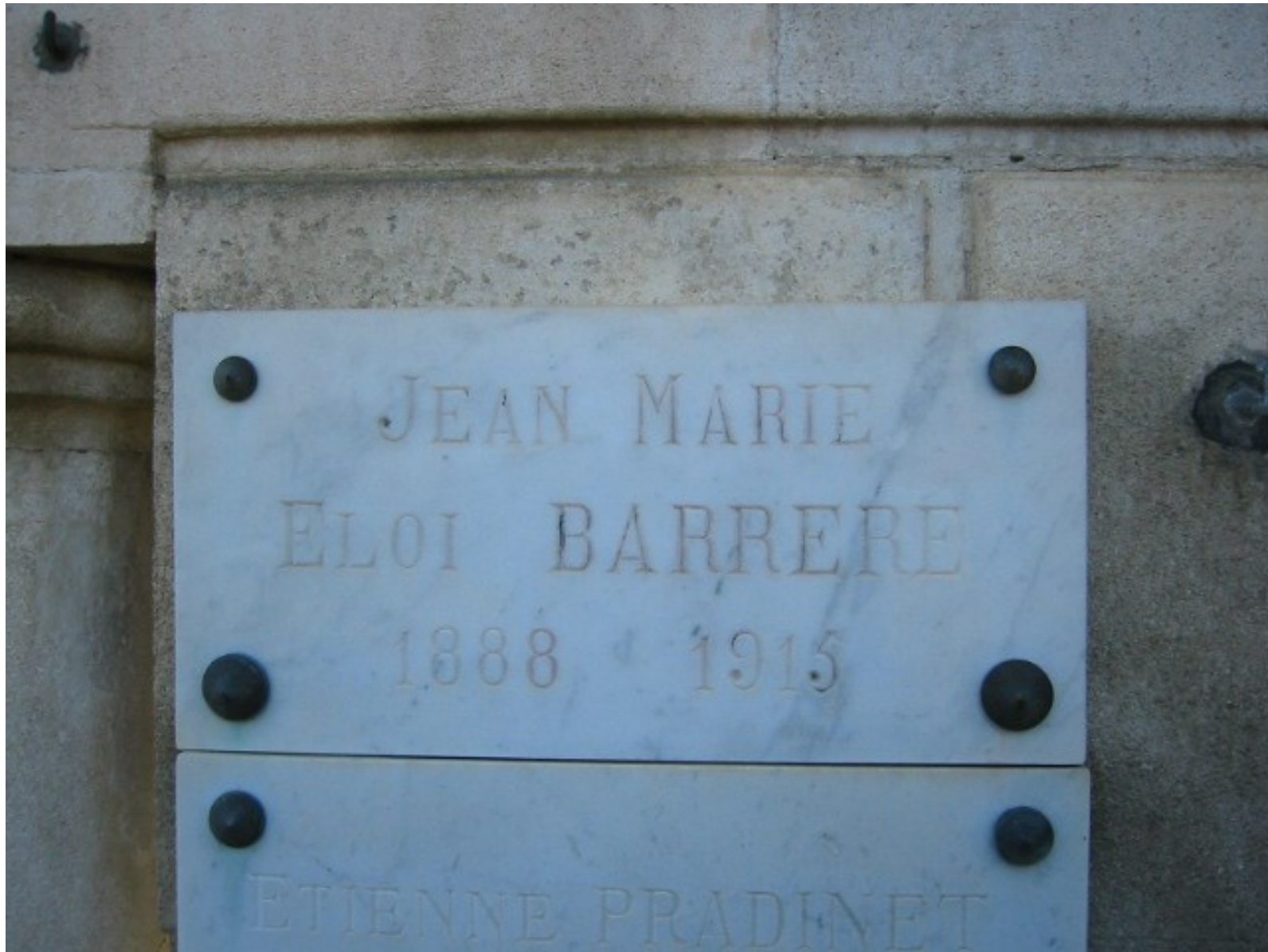
SAINT-LYS, cimetière du Village, concession A.028 (caveau BARRÈRE, référence 1922/062) : sépulture d'Éloi BARRÈRE.