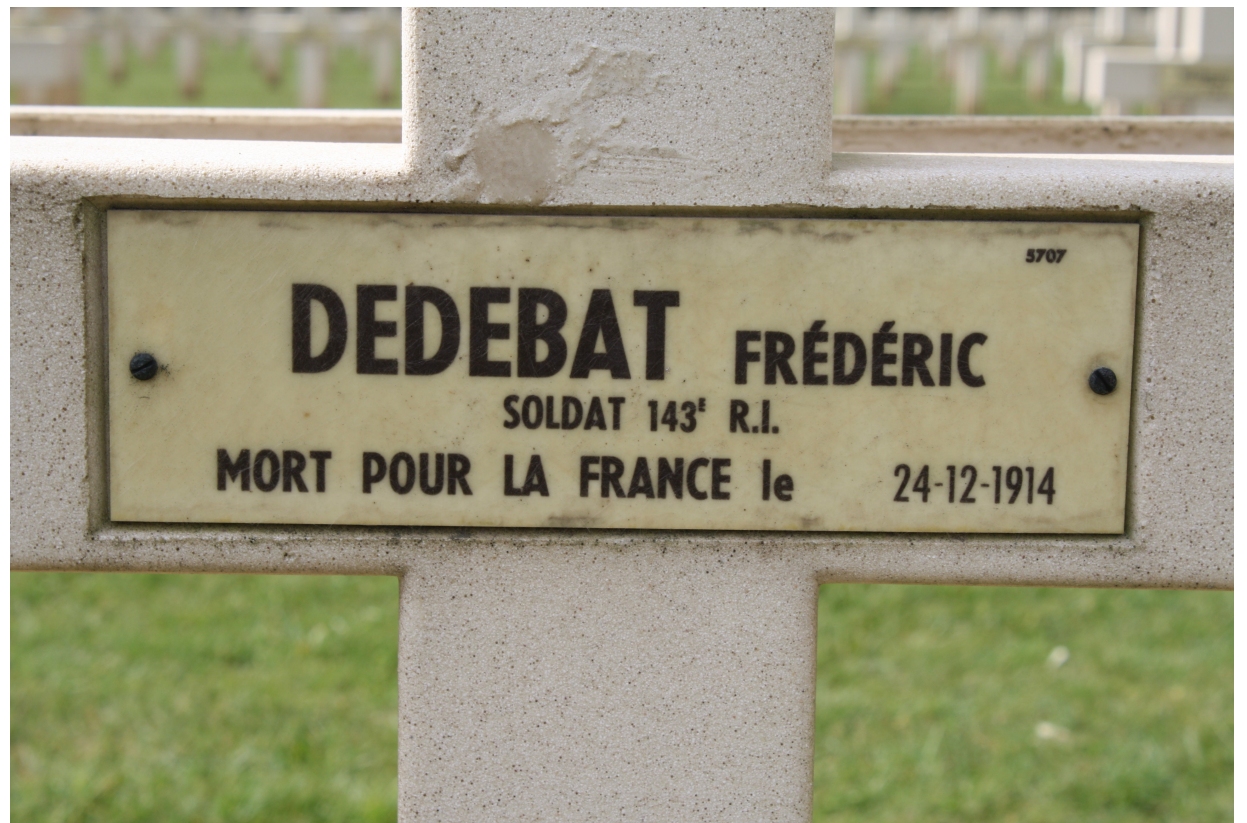
Tombe de Frédéric Julien DÉDÉBAT. Nécropole nationale « Notre-Dame-de-Lorette » à ABLAIN-SAINT-NAZAIRE (Pas-de-Calais), carré n° 29, rang 4, tombe individuelle n° 5707.