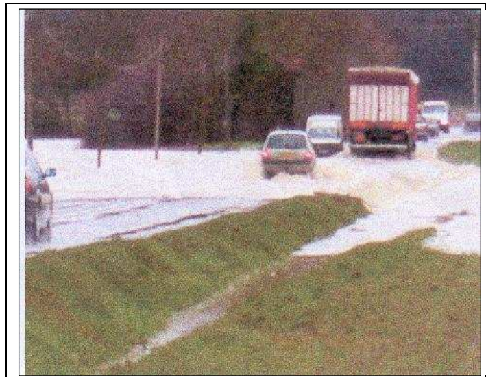
Photo n° 1 : Commune de Saint-Lys : route D12 Muret - Saint-Lys au niveau du lieu-dit « Terre Blaque ». La photographie montre la hauteur de la crue sur la route (0,30 m) à 17h00 le 4 février 2003.

Dans ce secteur de vallée, le Touch et ses affluents sont endigués. Ces digues sont en majorité plus basses en rive gauche (commune de Saint-Lys) qu'en rive droite (commune de Seysses). De plus, l'érosion et la faiblesse des berges à certains endroits favorisent les débordements (Tourrasse en 1993 et 2003).